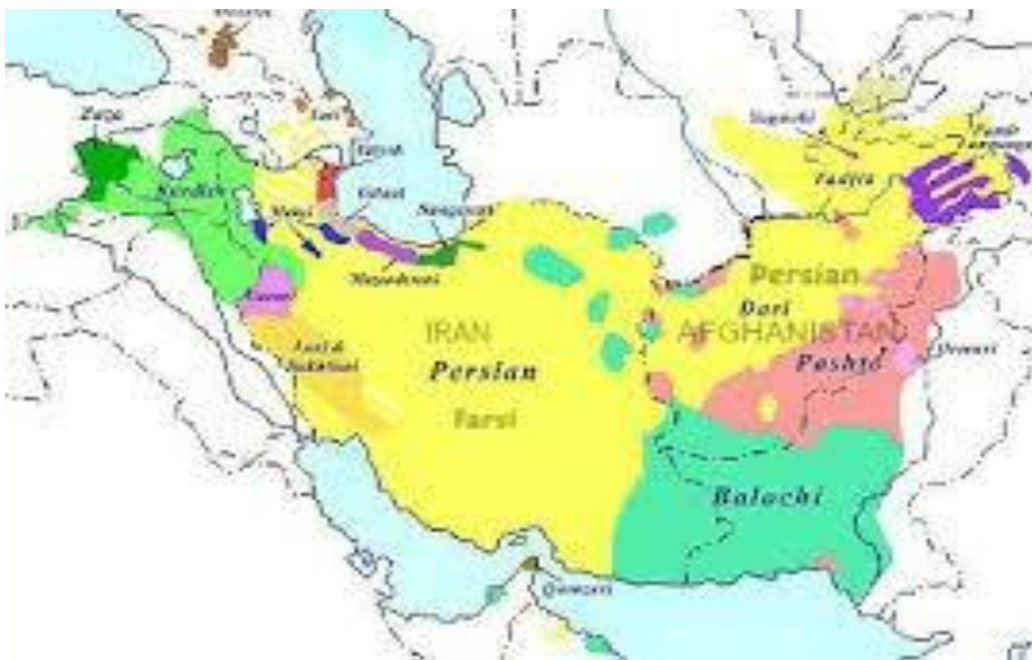
نقشه ۴-۱ قلمروهای فارسی‌زبان ( https://dlsdc.com/blog/pashto-dari-and-farsi/ )

از ۱۱۰ میلیون نفر به این زبان صحبت می‌کنند (ابوالحسن شیرازی، ۱۳۹۷: ۱۸). بنابراین زبان فارسی با توجه به سابقه دیرینه خود و قابلیت‌های ادبی جهانی که دارد و با توجه به ریشه تاریخی که در کشورهای مختلف منطقه دارد، تنها به‌عنوان یک زبان که وسیله ارتباطی باشد، مورد توجه نیست، بلکه به‌عنوان یک میراث ارزشمند بشری همچون زبان یونانی و لاتین مورد توجه مجامع علمی و زبان‌شناسی جهان است. این ظرفیت زبان فارسی قدرت قلمروسازی و ایجاد حوزه نفوذ فرهنگی و در نتیجه سیاسی و اقتصادی را برای ایران در سیاست خارجی بیشتر از هر زبان دیگری فراهم می‌نماید. از این جهت، توجه به این زبان به‌عنوان یک عامل قوی در دیپلماسی فرهنگی به‌ویژه در کشورهای فارسی‌زبان می‌تواند چالش‌های ناشی از تقابل‌های غیرضروری را کاهش دهد و جایگزین مناسبی برای عوامل چالش‌برانگیزتر در حوزه سیاست خارجی باشد.