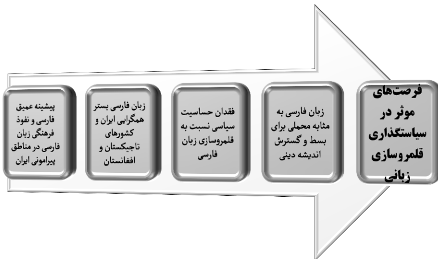
شکل (۲) فرصت‌های مؤثر در سیاست‌گذاری قلمروسازی زبانی ترسیم (از نگارندگان).

زبان فارسی به خاطر ویژگی‌های ساختاری، غنای مفهومی، گستردگی واژگانی و شعرا و نویسندگان و متفکران درجه اولی که به این زبان گفته، نوشته و زندگی کرده‌اند، شاید یکی از نخستین محمل‌های فرهنگی-زبانی بسط و گسترش دین اسلام بوده است. اینکه در تمامی این کشورها مردم به زبان فارسی صحبت می‌کنند و مراسم و امورات دنیایی خود را با این زبان اداره و تمشیت می‌کنند گواه‌گویی بر این مسئله است؛ بنابراین برای متفکران دینی که دغدغه ترویج و توسعه اندیشه دینی را دارند و از این طریق به حوزه قلمروسازی هم فکر می‌کنند، بدون کمترین مبالغه زبان فارسی مطلوب‌ترین و راحت‌ترین ابزار و روش ممکن است.