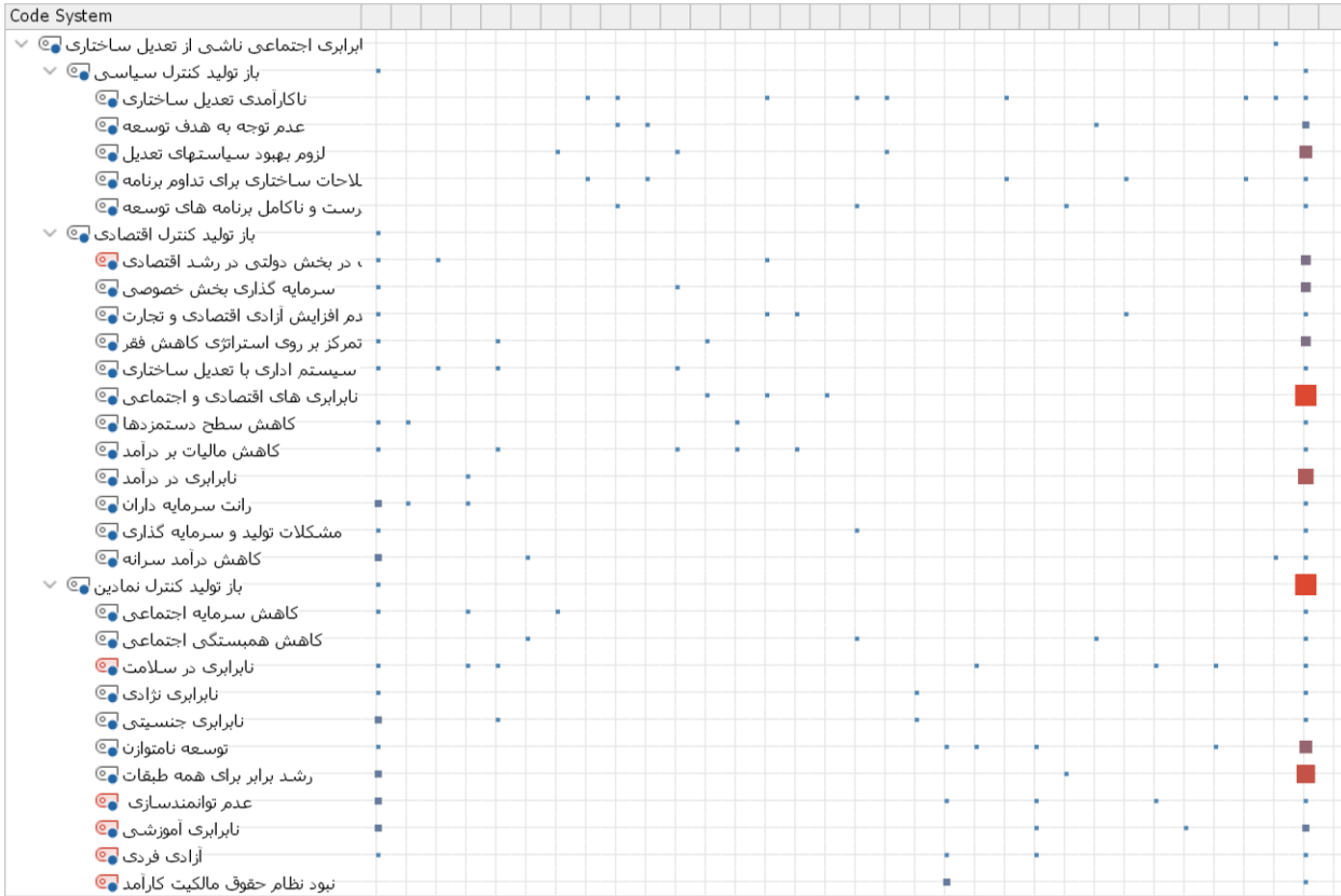
شکل ۲: توافق میان شاخص ها

گرافیکینشان می دهد. طبق شکل برخی مقالات که در اول و آخر بررسی شده اند دارای فراوانی بیشتری از متغیرها هستند.