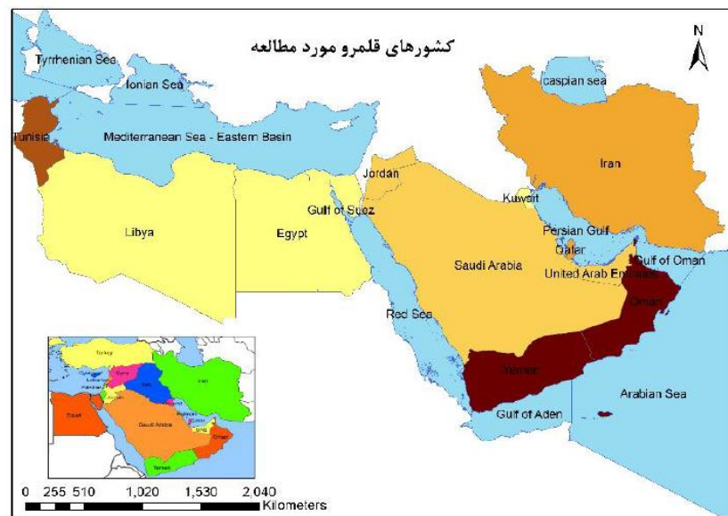
شکل ۱: منطقه جغرافیایی خاورمیانه و کشورهای این منطقه

خاورمیانه یا آسیای جنوب غربی در متون کلاسیک به عنوان یک حوزه جغرافیای وسیع به کار برده می‌شود که چندین منطقه مشهور را که در مطالعات منطقه‌ای به مثابه مناطقی جداگانه محسوب میشوند، در خود جای می‌دهد. بخش‌هایی از منطقه قفقاز، ایران، پاکستان و افغانستان، بخش‌هایی از آسیای میانه، عراق، ترکیه، کشورهای حاشیه خلیج فارس، سوریه، لبنان، فلسطین و گاهی مصر نیز در ادبیات رایج به عنوان بخشی از آسیای جنوب غربی به کار می‌روند. در واقع در این نگاه، آسیای غربی مجموعه‌ای از ۵ منطقه تلقی می‌شود که در مطالعات کلاسیک منطقه‌ای مجزا از هم فرض می‌شوند. بر اساس این نقشه آسیای جنوب غربی منطقه‌ای از شمال شبه قاره هند، آسیای میانه، قفقاز، آسیای صغیر، منطقه خلیج فارس و بخش عمده خاورمیانه به معنای مصطلح آن را در بر می‌گیرد. این نگاهی است که حتی در برخی برنامه‌های بهداشتی و مهاجرتی سازمان ملل متحد نیز وجود دارد.