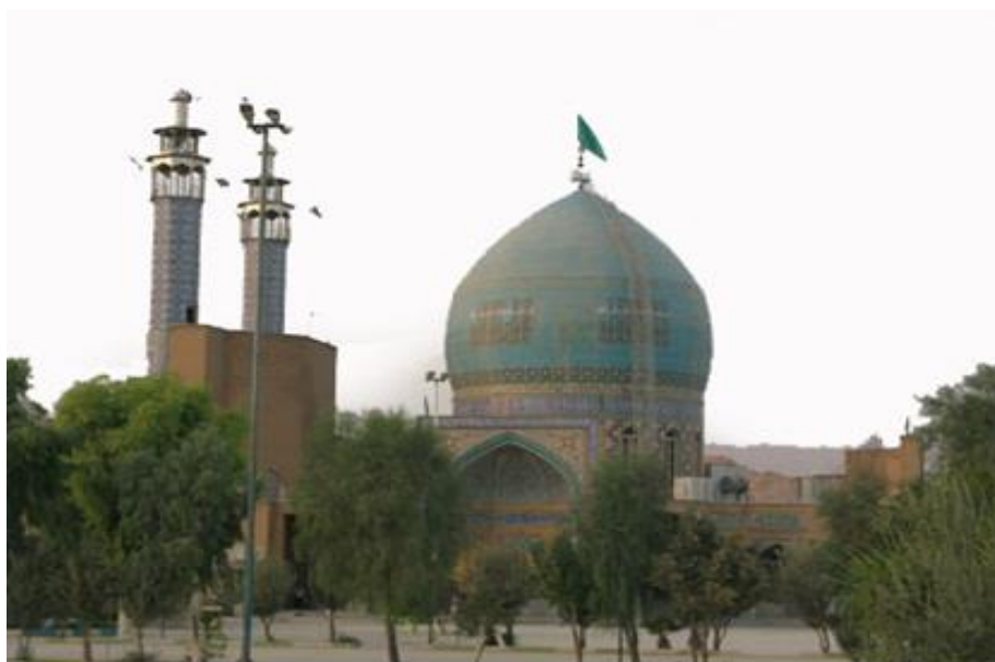
تصویر ۶ : حرم احمد بن اسحاق ، نگارنده ، ۱۳۹۴

ابوعلی احمد بن اسحاق اشعری قمی از اصحاب امام محمد تقی و امام علی نقی و امام حسن عسکری بوده و در نزد امام حسن عسکری امتیاز خاص داشته است او در قم وکیل آن حضرت بوده و پس از وی از وکلای امام زمان (عج) به شمار می رفتند و او در عصر خویش پیشوا و بزرگ علما و فقها و محدثین قم بود و در میان انبوه علمای قم بخصوص دانشمندان اشعری خاندان خود که اکثریت فقها محدثین قم را تشکیل می دادند چهره ی درخشان و فرد شاخص و سرشناس آنها بود. شیخ طوسی در کتابش به نام « رجال » می نویسد: ابوعلی احمد بن اسحاق بن عبدالله بن سعد بن مالک بن احوص اشعری قمی از دانشمندان و محدثین سده سوم هجری است او بارها به حضور امامان هم عصرش شرفیاب شد و مودت و ارادت خویش را به پیشگاه مقدس آنان ابراز داشت او عالمی زاهد، فقیهی پارسا و محدثی بزرگ از خاندان معروف اشعری و اهل قم بود که از در یای دانش امام جواد و امام هادی (ع) دانش آموخت و از امتیازی ویژه در نزد امام حسن عسکری (ع) بر خور دار بود (شرح نهج البلاغه، ۸ / ۳۰۳) تا آنجا که می توان او را از آن مولود مبارک بشارت داد. در فرازی از نامه آمده است ای احمد بن اسحاق دوست داشتم این خبر را به تو بدهم تا به این سبب خداوند تورا خوشحال کند، آنگونه که مرا خوشحال نمود با وجود انبوه علما و