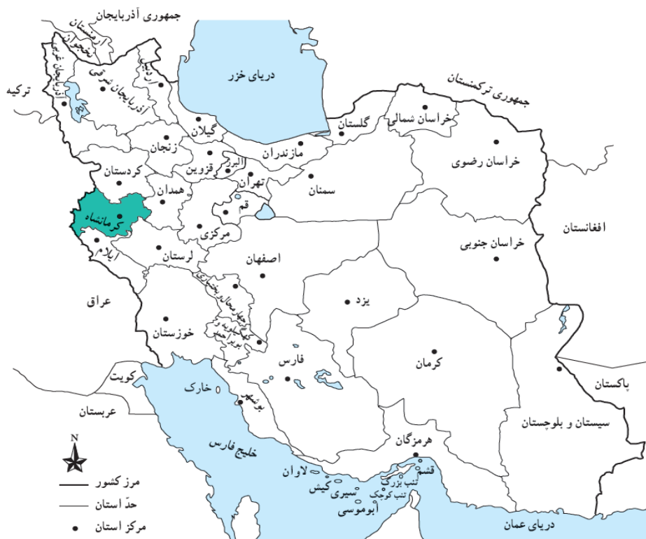
تصویر ۱: موقعیت کرمانشاه در نقشه ایران ۱۴۰۰، از نگارنده