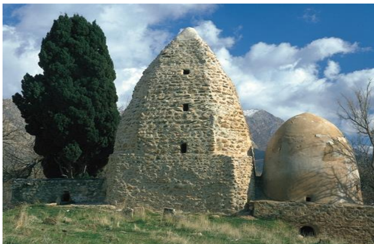
تصویر ۷ : ابو دجانہ ، عکس از نگارند ، ۱۳۹۵