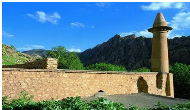
تصویر ۸ : مسجد عبدالله بن عمر عکس از نگارنده ۱۳۹۴

این مسجد یکی از مساجد تاریخی صدر اسلام است که در روستای شالان از توابع ریجاب در نزدیکی سرپل زهاب واقع شده است مسجد عبدالله بن عمر یکی از مسجدهای تاریخی استان کرمانشاه است که در ریجاب قرار دارد و در دوران صدر اسلام بنا شده است این مسجد در مرکز روستای ریجاب قدیم (ریجاب بالا) قرار دارد از لحاظ جغرافیایی وابسته به حلوان بوده است. بنای این مسجد مستطیل شکل بوده و از قلوه سنگ و ملاط ساخته شده است محراب مسجد برخلاف سایر مساجد اسلامی از دیوار جنوبی بیرون نیامده بلکه به وسیله گچبری به دیوار مسجد اضافه شده است. منبر مسجد پشت به محراب ساخته شده و مصالح آن سنگ و گچ می باشد. این منبر دارای پنج پله است. این بنا از ابنیه‌های قبل از اسلام بوده که در روزگار اسلامی به مسجد تبدیل شده است. محققین بنای این مسجد را به عبدالله بن عمر، فرزند خلیفه دوم مسلمانان نسبت می‌دهند. (محمودی، ۱/ ۳۵).