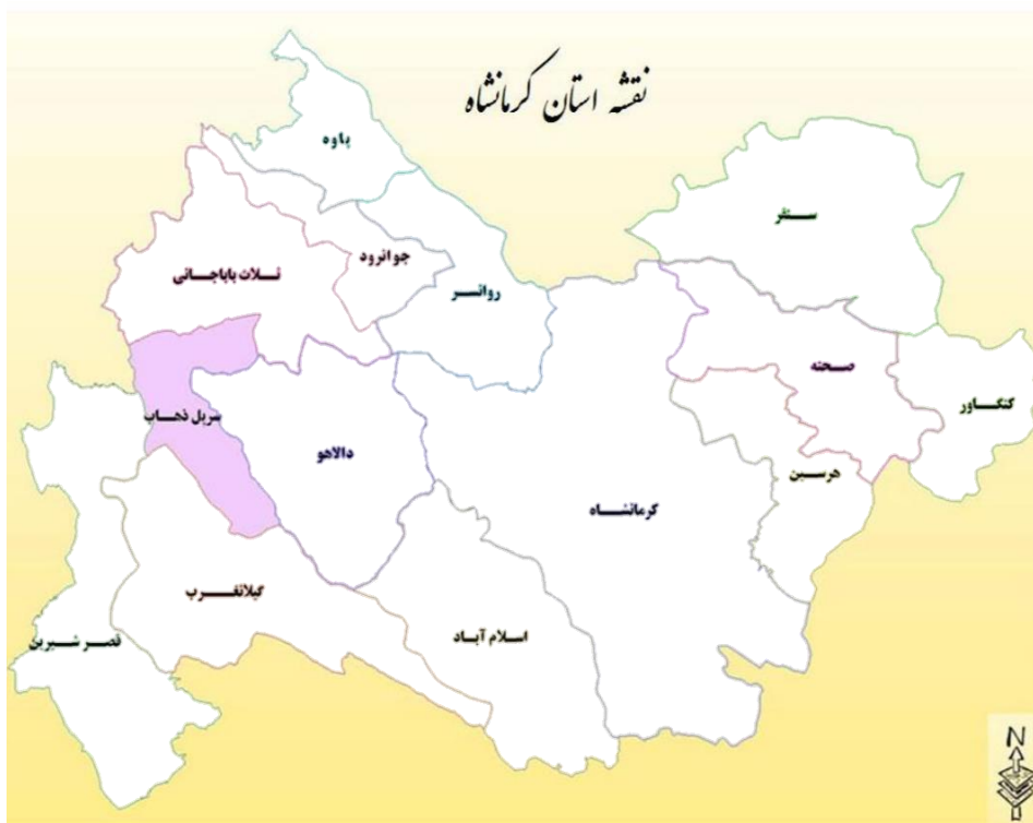
تصویر ۲: موقعیت حلوان (سرپل زهاب امروزی) در نقشه استان کرمانشاه ۱۳۹۹ از