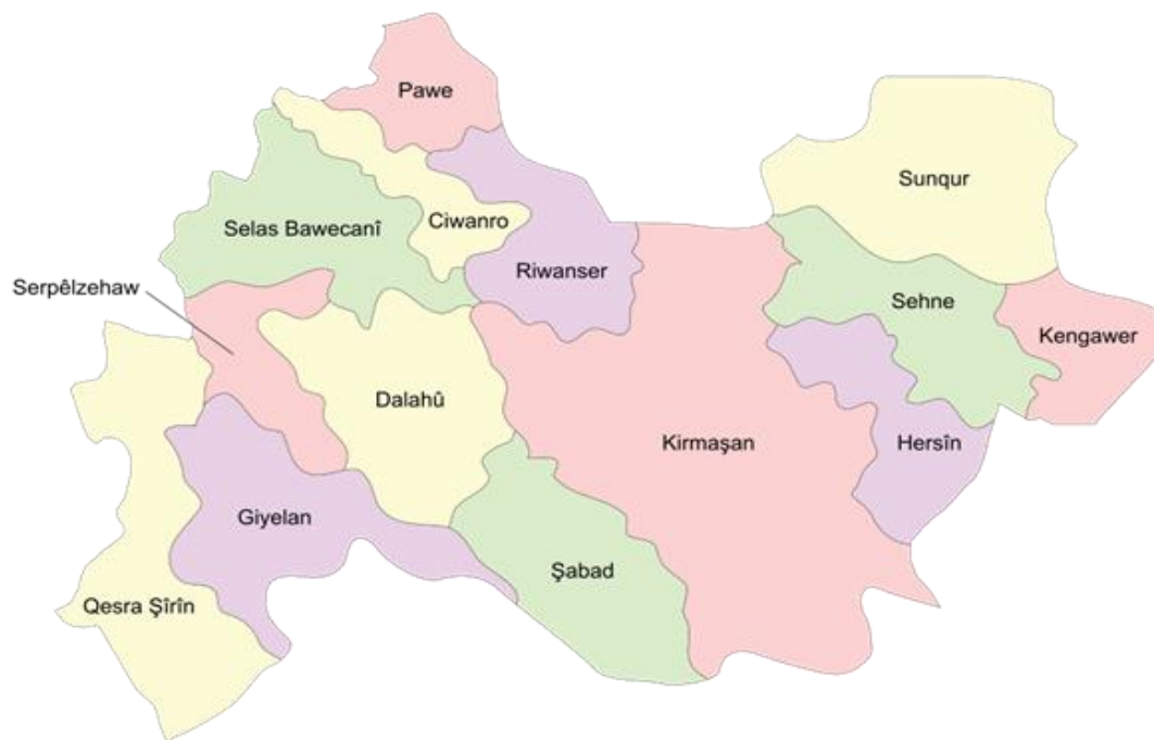
تصویر ۵. نقشه استان کرمانشاه و موقعیت سرپل ذهاب (حلوان)

این شهر از دوره باستان تاکنون موردتوجه بوده است و به‌ویژه در عصر حاضر خاورشناسان باستان‌شناس به مطالعه آن پرداخته‌اند، و آن را یکی از هشت شهر باستانی دنیا دانسته‌اند (راویلینسون، ۱۵۶/۱).