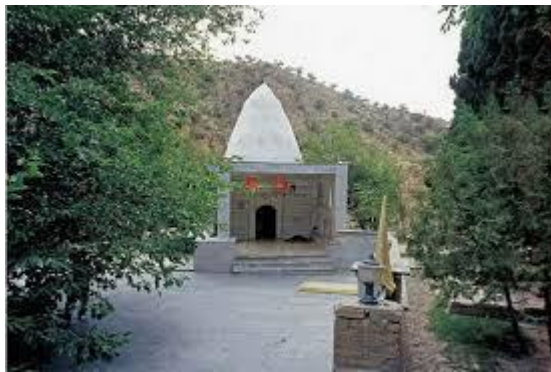
تصویر ۹: بابایادگار، ۱۳۹۵

قلعه یزدگرد و در دامنه کوه تخت سرانه در دالاهو قرار دارد. بابا یادگار در باور یارسان از طرفداران و همراهان سلطان سهاک و مادری به نام «داده سارا» (دادا ساری) بوده در سده هشتم هجری متولد شده و در هنگام جوانی بنا به دستور سلطان سهاک برای گسترش دادن آیین یارسان به هندوستان و پاکستان رهسپار شده است (سایت جامع گردشگری ایران دانش‌نامه یارسان) بابا یادگار متأهل نشده و فرزندی نداشته است. او دو نفر از یارانش به نام خیال و وصال به سمت «پیر» بر مریدانش، جانشین خود گردانید و سادات خاندان بابایادگار از نسل آن دو نرفتند. دشمنان یارسان بابایادگار را کشتند و یارانش او را در دامنه کوه تخت سرانه در روستای زرده در استان کرمانشاه به خاک سپردند که آرامگاه بابا یادگار هم‌اکنون در آنجا قرار دارد. از او مجموعه‌ای از کلام مقدس به نام «زالال زلال» به جای مانده است. همچنین در میان جواهرات، یاقوت جلوه بابا یادگار است (صفی زاده، ۱۰۳/۱) آرامگاه بابا یادگار، در دامنه کوه تخت سرانه در روستای زرده از نظر معماری این بنا به صورت فضای مربع شکل کوچکی است و بر روی آن گنبد مخروطی شکلی قرار گرفته است. سطوح داخلی و خارجی این بنا به وسیله ملات گچ اندود شده است. این مقبره، یکی از زیارتگاه‌های مهم یارسان به‌شمار می‌رود. بیش تر از این مشایخ در اوایل حکومت صفویان زندگی می‌کردند و در نوار مرزی ایران و عثمانی به ترویج دین یارسان اشتغال داشتند. در نزدیکی زیارتگاه بابایادگار چشمه غسلان، هفت تن، چهل تن و هائیتا از جمله زیارت‌گاه‌های یارسان به‌شمار می‌رود. (طاهری، ۴۵۹ / ۱)